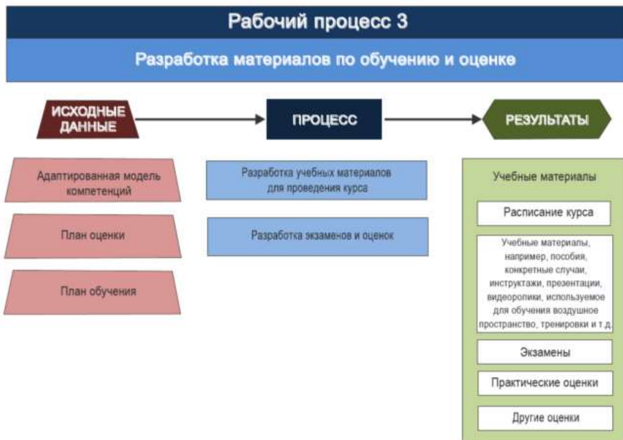
Рис 5 Рабочий процесс 3. Разработка материалов по обучению и оценке

Для каждой конкретной функции оператор должен подготовить учебные материалы в соответствии с Основным контрольным списком. (Master check list)